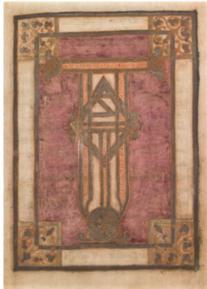
Saint-Omer, BASO, ms. 342 bis, folio 64 recto