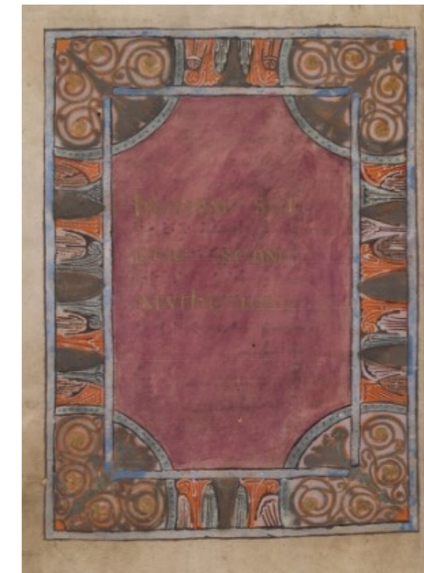
Saint-Omer, BASO, ms. 342 bis, folio 1 verso